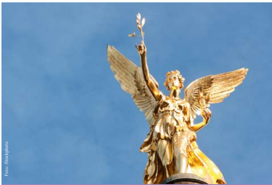
Friedensengel in München

ehe der letzte „TOP“ erschöpfend behandelt ist), und wenn man nicht wüsste, dass auch Pfarrerinnen und Pfarrer der Runde angehören, könnte man glatt vergessen, dass da ein Gremium der evangelisch-lutherischen Kirche tagt und nicht irgendein Zweckverband. Da geht es, natürlich, um Geld und um Projekte, für die eben dieses Geld fehlt, um Ausschussarbeit, Organisationsfragen und Verschiedenes, das mit Leidenschaft und Ausdauer diskutiert wird. Aber was Kirche zur Kirche macht und Gemeindeleben von Vereinsaktivitäten unterscheidet, das erschließt sich an solchen Abenden nicht so ohne weiteres.